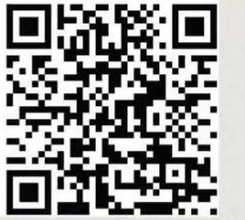
詳細はこちらから！