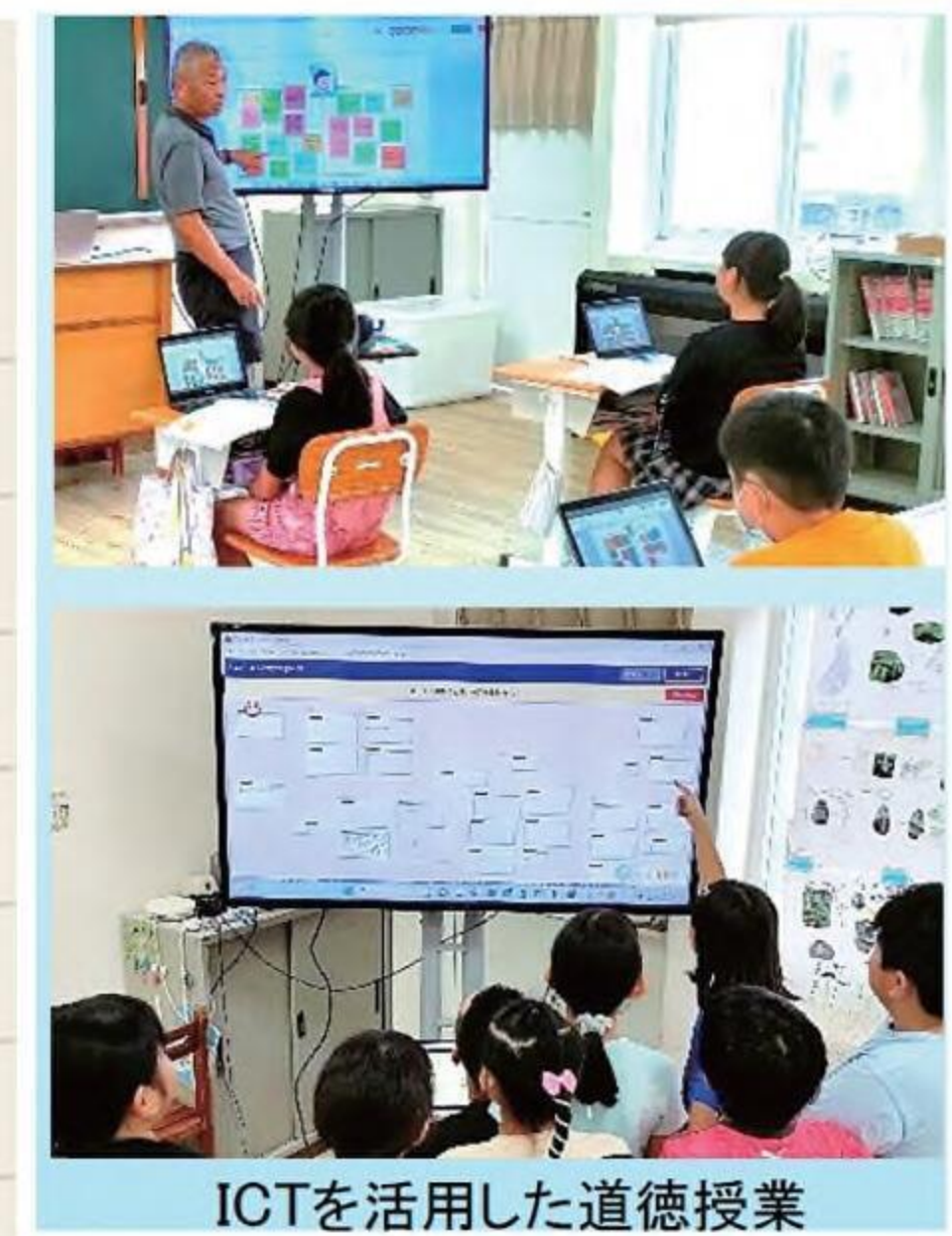
ICTを活用した道徳授業

◇本校においても、各活動における道徳教育の要として、児童生徒の道徳的判断力、道徳的心情、道徳的実践意欲と態度を養うために、「特別の教科 道徳」の授業に力を入れています。