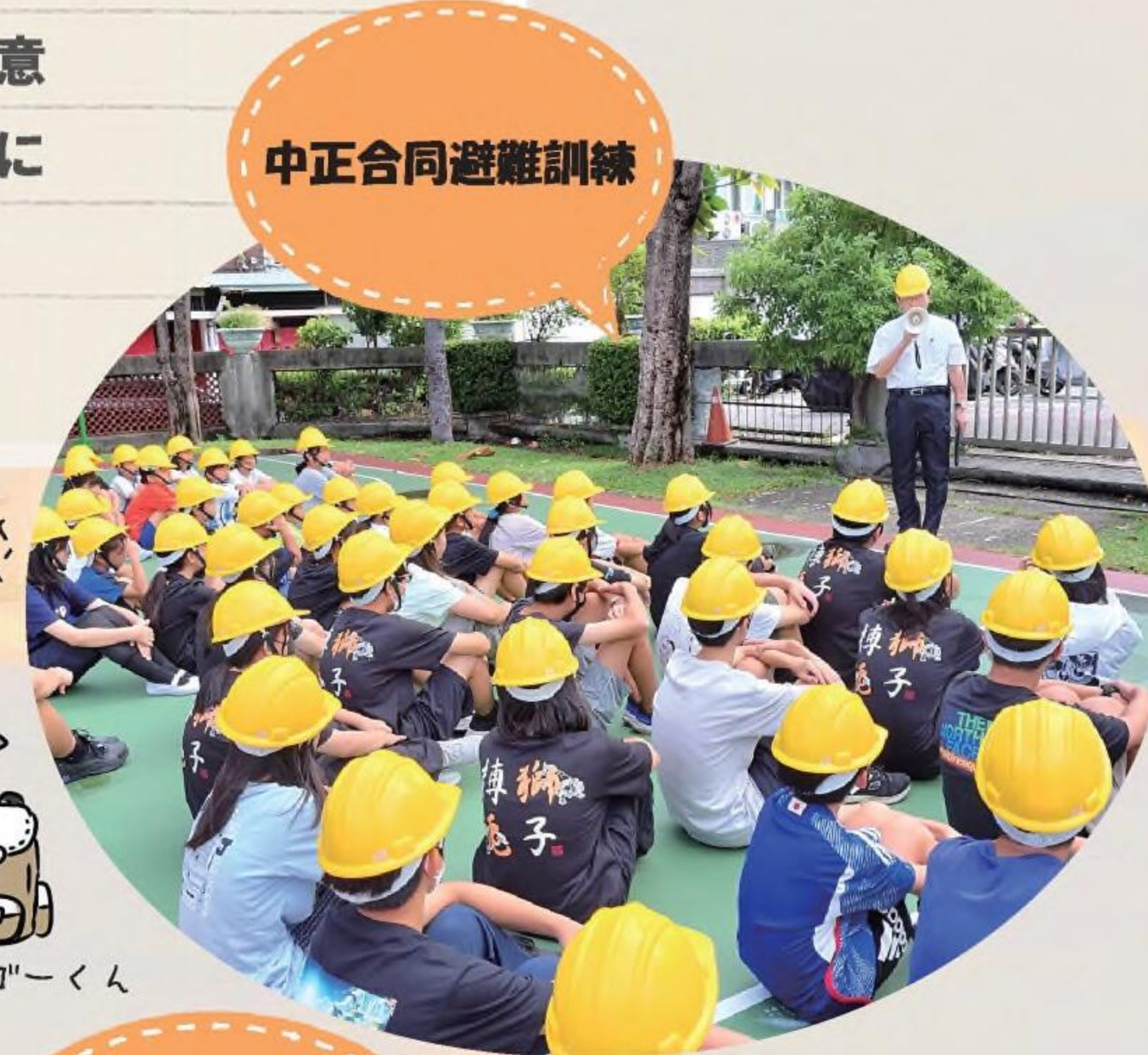
中正合同避難訓練

9月13日(金)に児童生徒会選挙が行われました。演説ではどの候補者も、学校を皆にとってもっと過ごしやすい場所にしていきたいという気持ちや、そのためにどのように取り組んでいくかという具体的な考えを述べていました。先輩たちから引き継いだ児童生徒会を更に発展させていってほしいと思います。