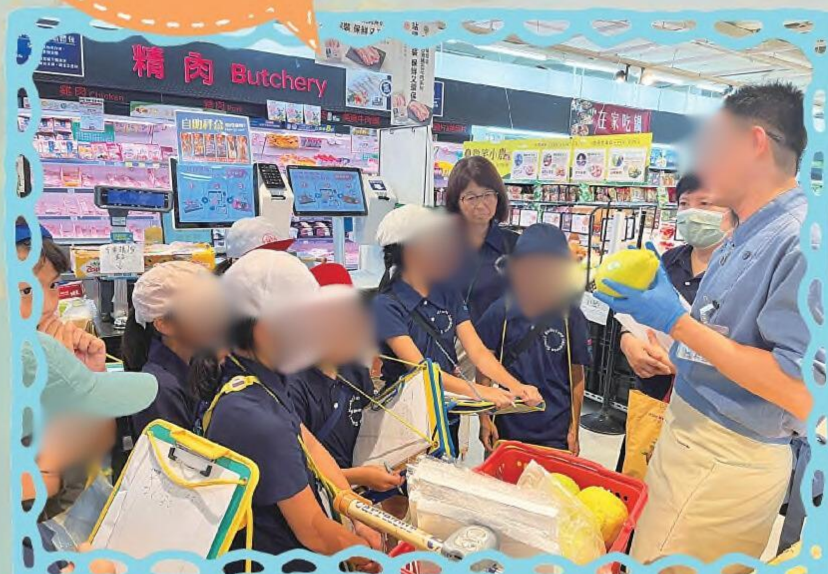
スーパーマーケット 見学 (小3)